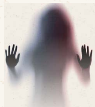
Jede/r kann teilnehmen: In der Vortragsreihe "Vom Reiz der Sinne" stellen Wissenschaftlerinnen und Wissenschaftler ihre aktuellen Forschungsergebnisse einem breiten interessierten Publikum vor und laden ein zur Diskussion.