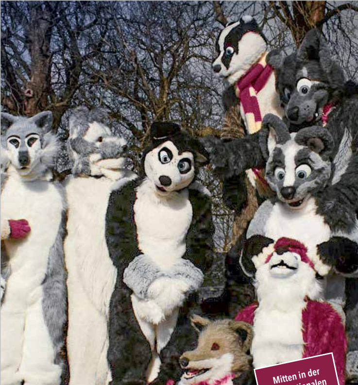
Mitten in der internationalen Woche des Gehirns